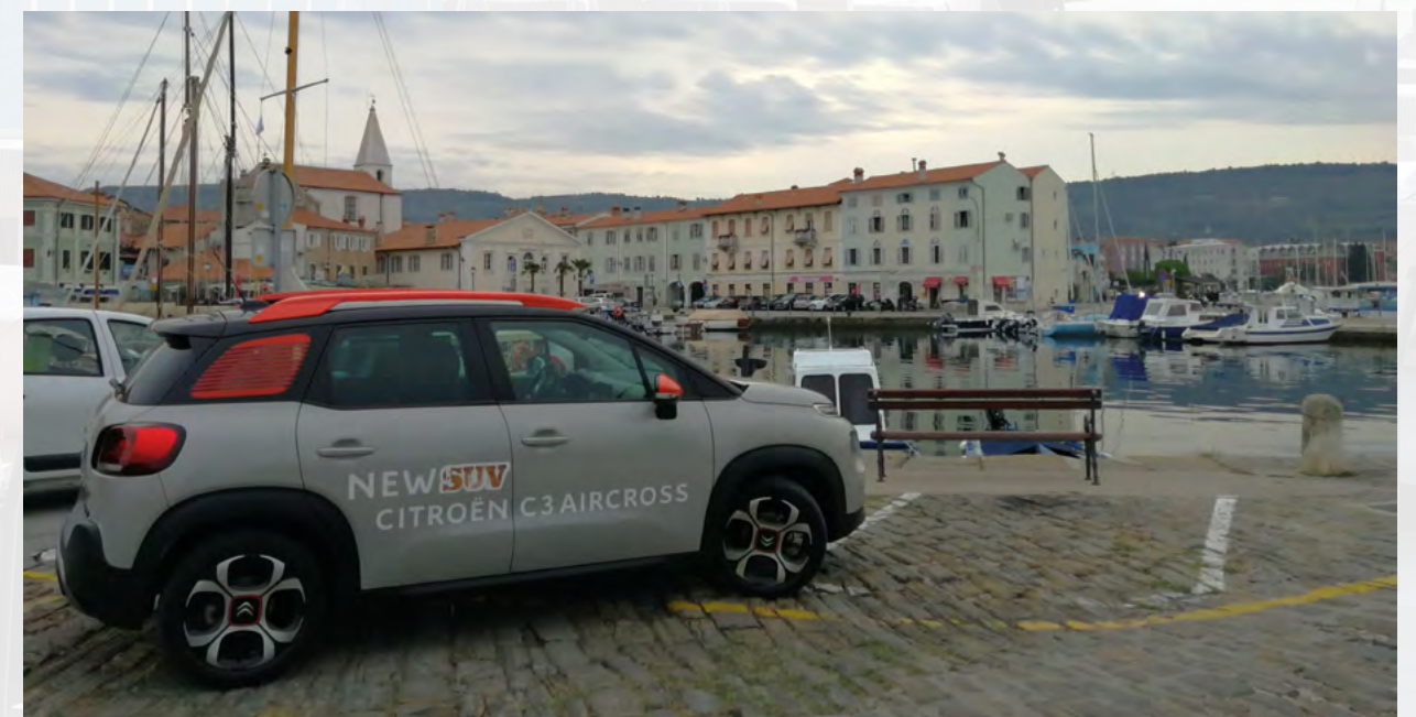
Terasa hotela Belvedere

Za one koji više vole da borave na rivi, tu je hotel Marina u kome smo bili smešteni, hotel sa tri zvezdice koji međutim ima sve kvalitete za četiri zvezdice. Iako je gradski hotel, odmah iza je plaža koja gleda na pučinu, zbog čega je ovde more i najčistije u Sloveniji. U hotelu postoji velnes centar koji se iznajmljuje za privatne posete sa finskom saunom, dakuzijem, a gosti dobiju i penušavo vino. Restoran hotela veoma je popularan, uvek je pun, ljudi dolaze iz svih krajeva da tu večeraju, a ispred restorana postoji i parking.