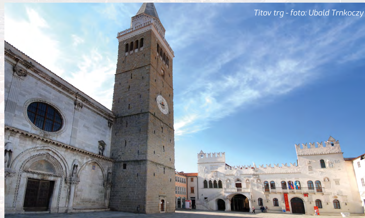
Titov trg

je bio pod Italijom, da bi 1954. ušao u sastav SFRJ. Osim što je važna luka, Kopar je i sedište fabrike motora Tomos i na celom slovenačkom primorju ljudi i dalje koriste ove motore, dok u Kopru postoji i muzej Tomosa. Gradsko jezgro Kopra sačuvalo se još od mletačkih vremena i na glavnom, Titovom trgu nalazi se Pretorska palata iz 14. veka, građena u gotičkom stilu, sa renesansnim dodacima iz 15. veka. Tu je i Loža iz kasnogotičkog perioda sa elegantnom arkadom u kojoj se danas nalazi najstarija kavarna iz 1846. godine. Impo-