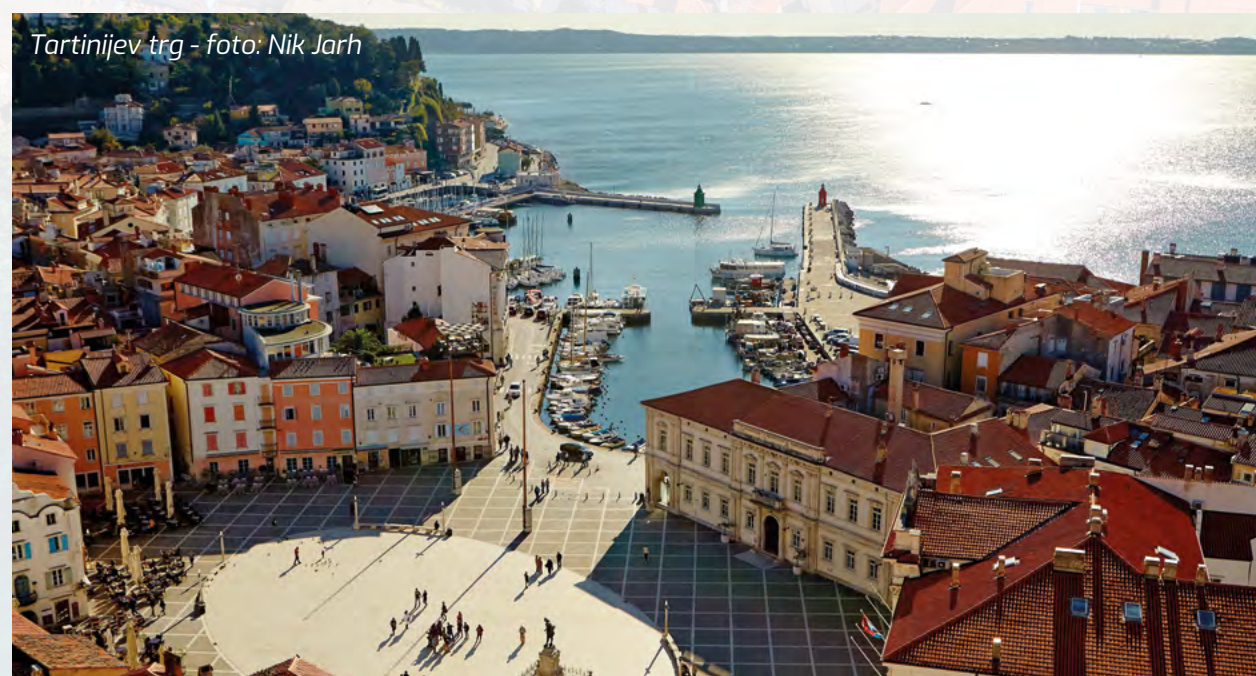
Tartinijev trg - foto: Nik Jarh

dragoj ovu kuću i postavio tablu s natpisom. Danas je u njoj mali hotel i prodajna galerija. U Piranu se nalazi veliki broj crkava, kao i franjevački manastir sa bunarom koji se i dalje povremeno koristi. Katedralu Svetog Đorda krase veliki zvonik rađen po ugledu na zvonik crkve Svetog Marka u Veneciji. Ručali smo u italijanskom restoranu La Bottega dei Saponi na Tartinijevom trgu. Mladi bračni par koji vodi ovaj restoran, ugstio nas je čorbom od bundeve sa grilovanim gamborima, rezancima sa škampima i crvenim radičem, a za desert smo probali amareti i pistači sladoled. Sve to uz vino malvaziju, poznato u ovim krajevima. U Piranu nema mnogo hotela, a često su i pomalo skriveni i vrlo ukusno uklopljeni u ambijent grada. Najstariji u gradu hotel Piran sa-