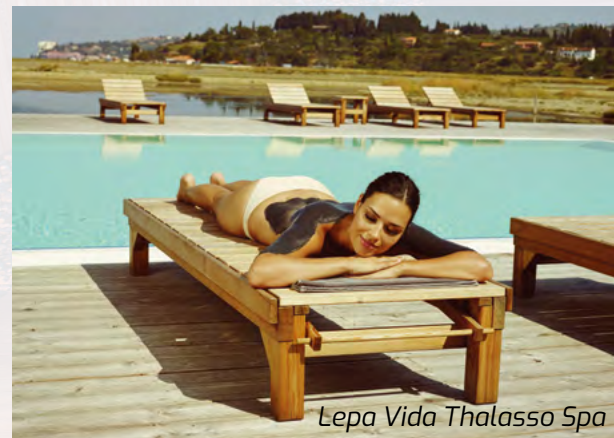
Lepa Vida Thalasso Spa

Pirana i za sve one koji žele šetnju kroz prirodu, ovo je idealno mesto. Utabana staza od pet kilometara vodi kroz šumu, a negde na sredini puta dolazimo do velikog krsta posvećenog Bogorodici koji je napravljen na mestu gde se Bogorodica ukazala mornarima tokom oluje i spasla ih sigurne smrti. Pored kamenog krsta nalazi se i zanimljiv drveni stub sa nekoliko rupica – šijunki kroz koje mogu da se vide različiti gradovi Tršćanskog zaliva, a ponekad čak i vrh Triglava.