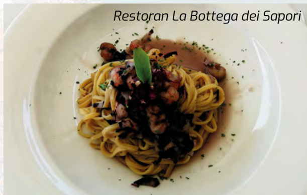
Restoran La Bottega dei Saponi

Iz mondenskog Portoroža odlazimo u stari primorski grad Piran u kome je u predrimsko doba živelo ilirsko pleme Histri po kome cela Istra nosi naziv. Od tada, pa sve do danas, Piran je bio naseljen i deo raznih država – od Starog Rima, preko Svetog rimskog carstva, Mletačke republike, Austrougarske, čak ga je kratko osvojio i Napoleon. Ovim bajkovitim gradićem dominira Tartinijev trg na kome centralno mesto zauzima statua Đuzepea Tartinija, italijanskog kompozitora baroknog perioda. Tartini je poznat po svojoj „Đavoljoj sonati“ za violinu koju je, po sopstvenom pričanju, komponovao pošto ju je čuo u snu, od samog đavola. Poreklom je bio iz Pirana i danas u gradu mnoga mesta, hoteli i restorani nose njegovo ime. Osim Tartinijeve statue, na trgu značajno mesto zauzima Mletačka kuća – Benečanka, kuća za stanovanje iz 15. veka građena u stilu venecijanske gotike. Na fasadi kuće, na drugom spratu nalazi se natpis Lasa pur dir – pusti ih neka pričaju – koji je, po legendi postavio bogati piranski trgovac, graditelj ove kuće. Naime, on se zaljubio u siromašnu devojkicu zbog čega je bio ismevan, ali da bi dokazao svoju ljubav, izgradio je svojoj