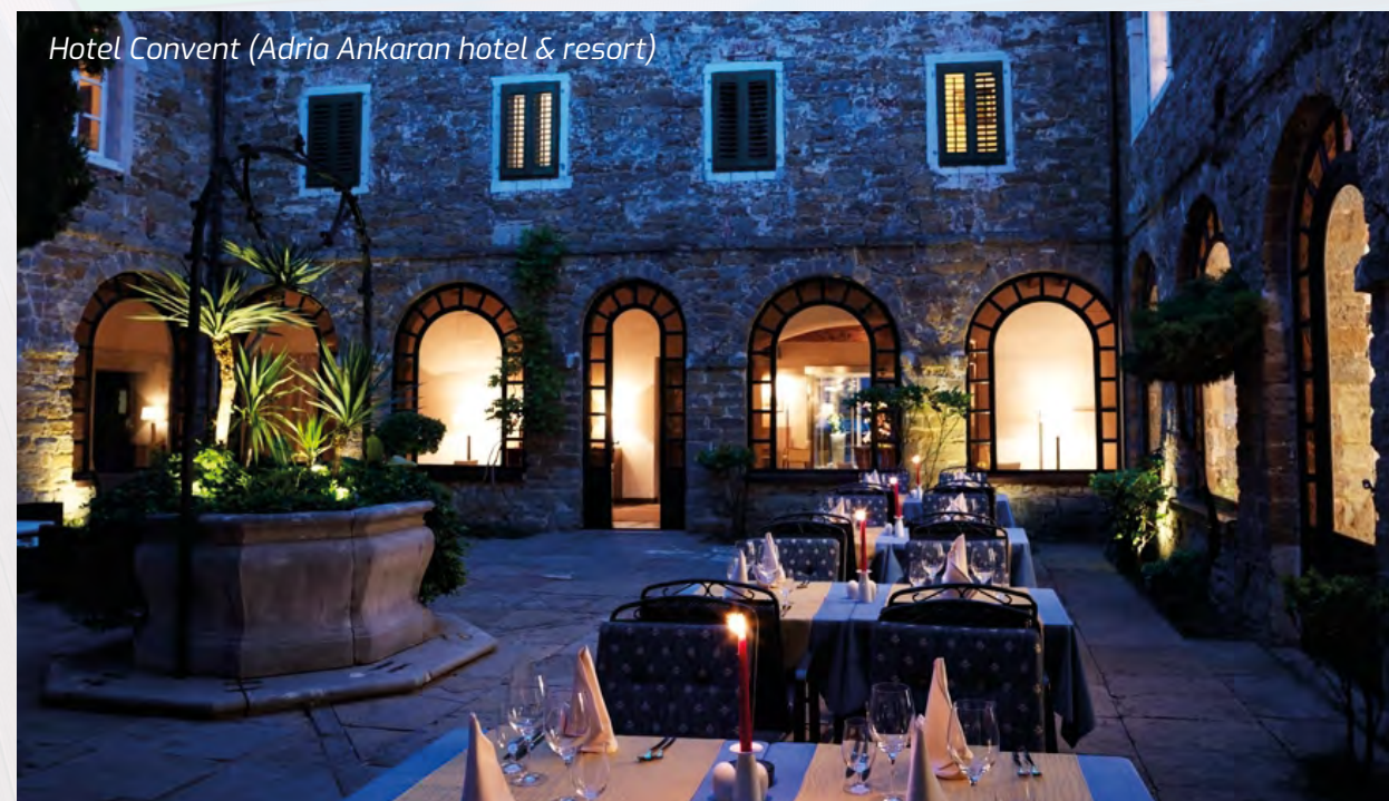
Hotel Convent (Adria Ankaran hotel &amp; resort)