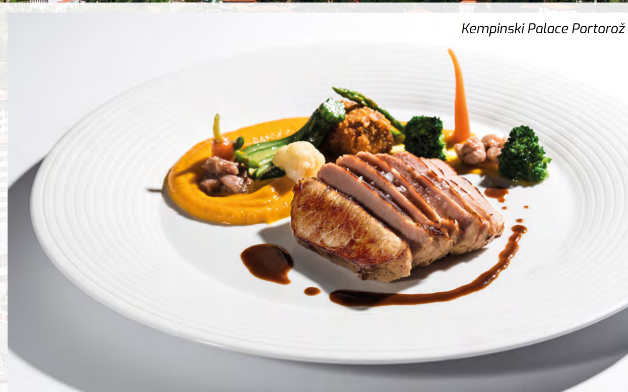
Kempinski Palace Portorož

Kempinski Palace hotel ove godine proslavlja deset godina postojanja i tim povodom napravljen je slavljenički paket Stay 3, pay 2 koji će trajati do sredine decembra. Ovaj luksuzni hotel sa pet zvezdica nudi bazen sa slanom vodom, spa i fitness centar, kozmetičke tretmane... Za kongrese i konferencije tu je šest sala, a moguće je ispred hotela postaviti