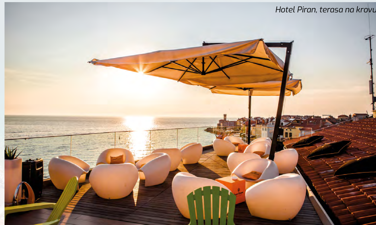
Hotel Piran, terasa na krovu

građen je još 1913. godine i namenjen je onima koji žele mir i tišinu. Ne organizuju kongrese, seminare, nemaju sale i hale, gosti mogu da se opuste na terasi na krovu sa koje se pruža neverovatan pogled na more i grad, kao i da ručaju ili pijuckaju kafu u restoranu i kafiću koji se nalaze na šetalištu.