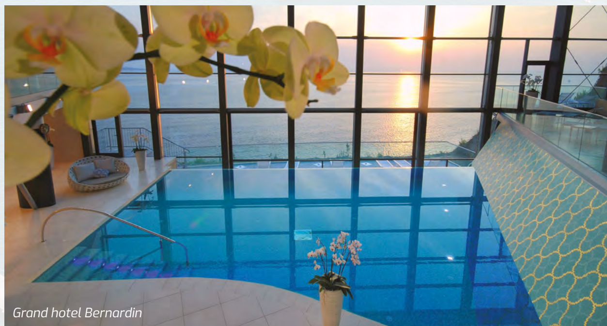
Grand hotel Bernardin

termalnom, praistorijskom morskom vodom (salinitet je vrlo visok), bazenom sa morskom vodom, tretmane sa lekovitim blatom. Od medicinskih tretmana ističu se ajurvedskim centrom u kome radi lekar iz Indije, imaju ajurvedsku saunu, joga instruktore. Zahvaljujući prostoru za kongrese i seminare, organizuju i do dve stotine događaja godišnje.