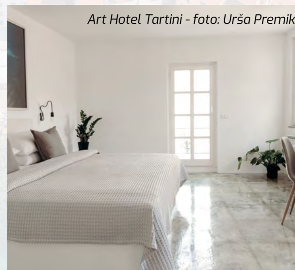
Art Hotel Tartini

pola tone stakla koja se spušta od poslednjeg sprata do prizemlja. Svaka soba je na svoj način umetničko delo i premda veoma moderan, hotel je prijatan i ušuškan. Izuzetno je dizajniran enterijer sale za konferencije iz koje se izlazi u skrivenu, unutrašnju baštu na nekoliko terasa.