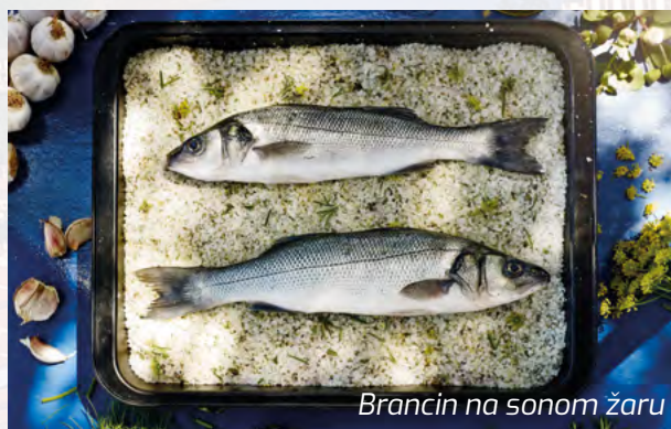
Brancin na sonom žaru

Za desert nas je domaćica počastila musom od borovnice sa mangom i ruzmarinom na tartu od badema i oraha, i još jednim slat-